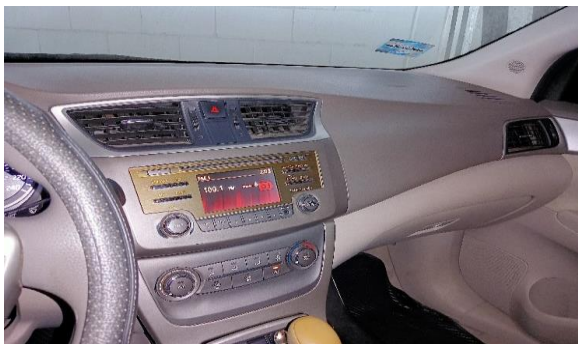
VISTA DEL INTERIOR