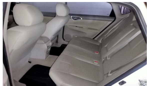
VISTA DEL INTERIOR