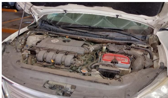
VISTA DEL MOTOR