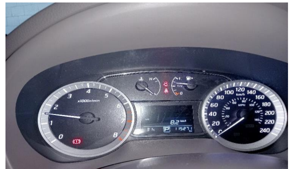
VISTA DEL TABLERO